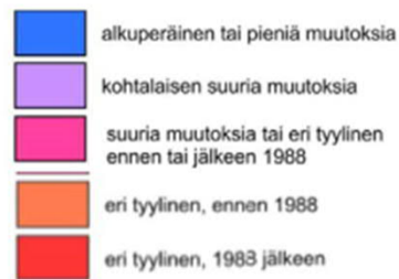
NIEMI - 2016