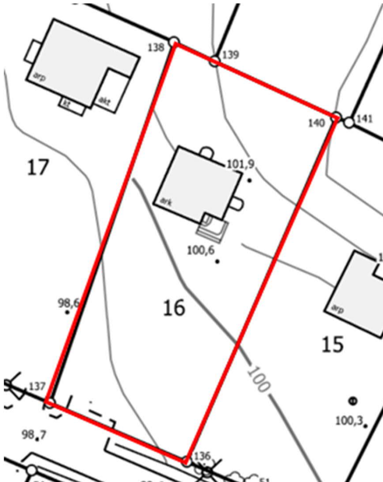
Sijainti Oskari-karttapalvelun virastokartalla: Kartta 3 – Kulttuuriperintö - Kantakaupungin yleiskaava 2040 ja valtuustokausi 2017-2021. Piirukatu 25 on rajattu karttaan punaisella.