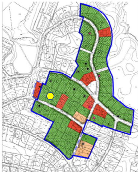
IKURI - JÄLKKÄRI