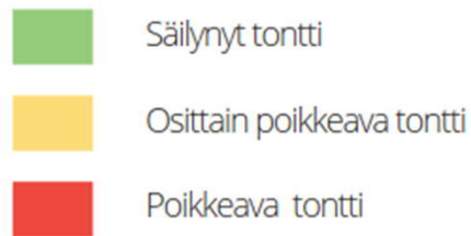
NIEMI - JÄLKKÄRI

Tässä selvityksessä on tarkistettu vuoden 2016 tonttikohtaista arvotusta ja arvoalueen rajausta. Edeltävän selvityksen jälkeiset muutokset näkyvät kartoilla, minkä lisäksi tässä selvityksessä käytetyt analysointimenetelmät ja arvotusperusteet poikkeavat hieman edellisestä.